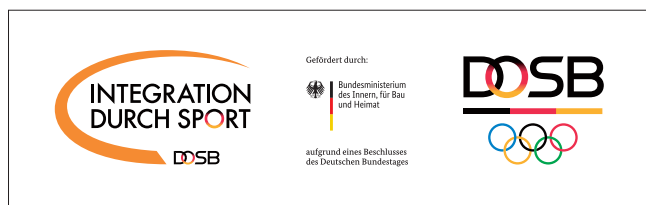
Composite-Logo IdS/BMI/DOSB – horizontal