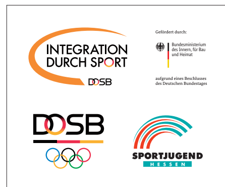
Composite-Logo IdS/BMI/DOSB/Länder – Beispiel Sportjugend Hessen – quadratisch