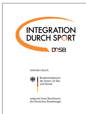
Composite-Logo IdS/BMI – vertikal