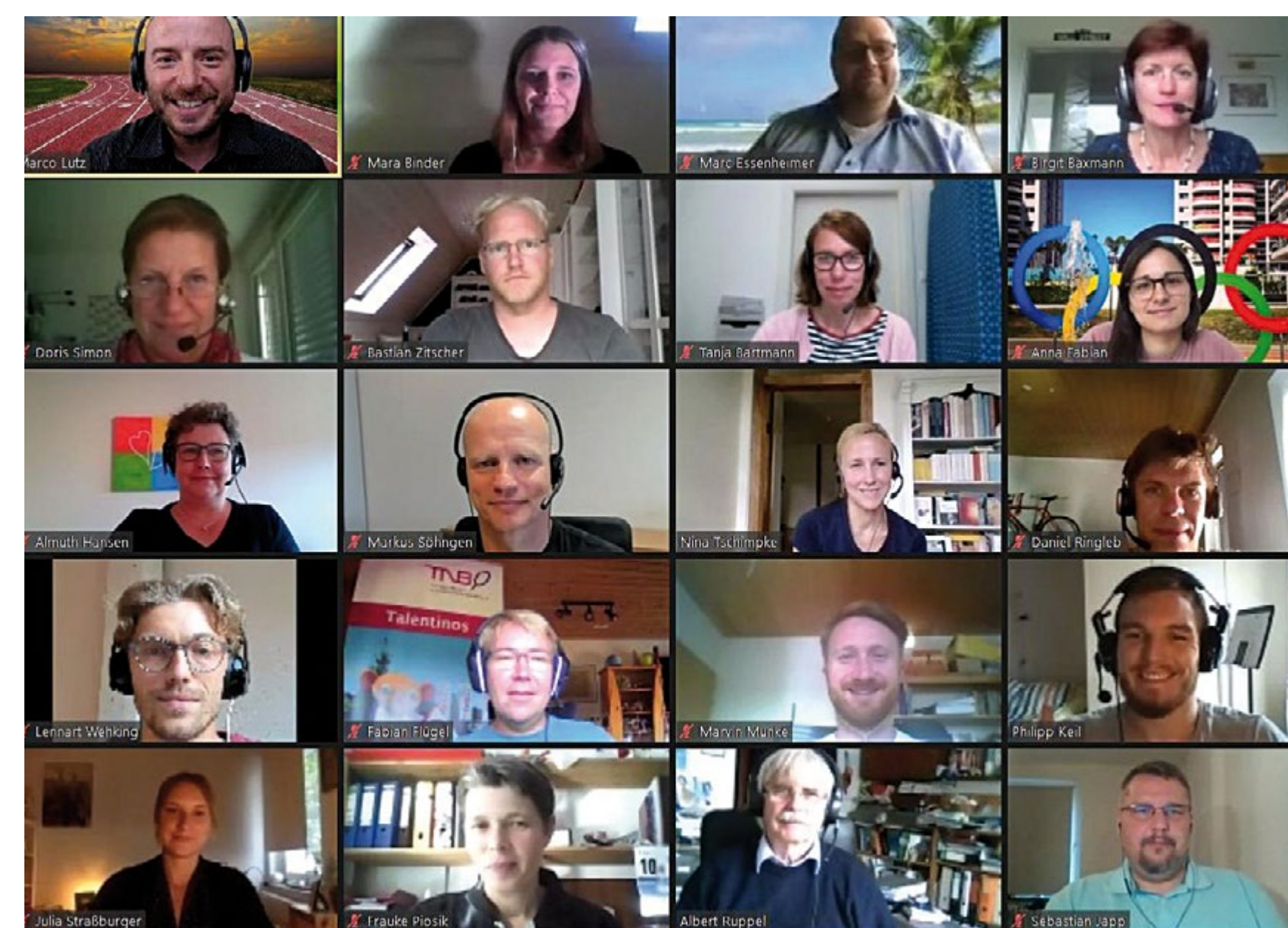
Screenshot vom Online-Präsenz-Wochenende

Hervorzuheben im Projektprozess ist die gewinnbringende interdisziplinäre Zusammenarbeit der einzelnen Projektmitglieder aus LSB Niedersachsen und den Fachverbänden Handball und Tischtennis.